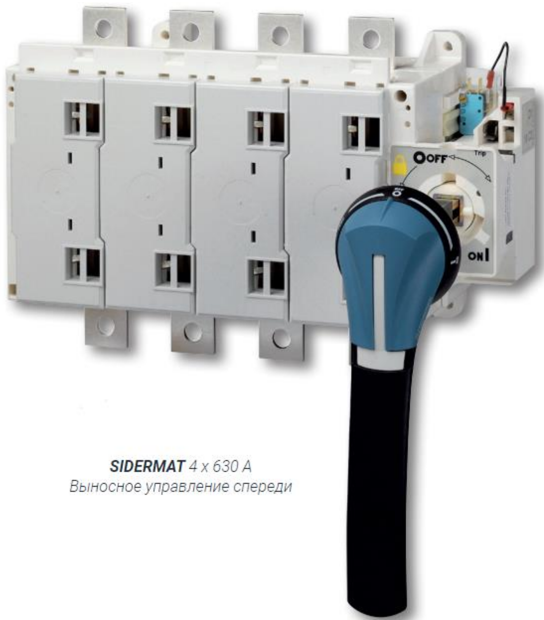
SIDERMAT 4 x 630 А Выносное управление спереди

Выключатели нагрузки для распределения мощности Устройство от 250 до 1800 А с функцией дистанционного отключения